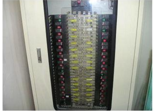
충전부 절연덮개 및 회로명 표시 ○