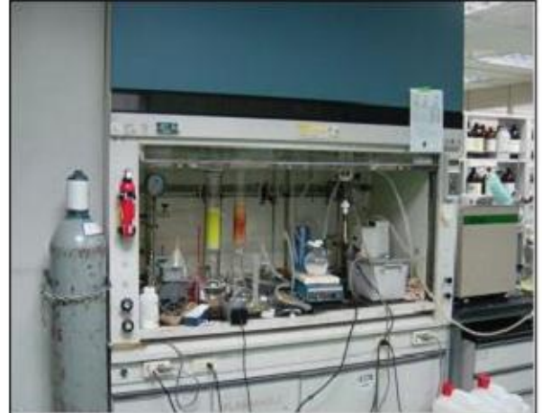
훈후드 내부 콘센트 및 정리정돈 미흡 ×