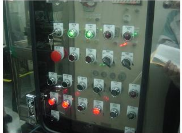
표시등 색상 상태 X