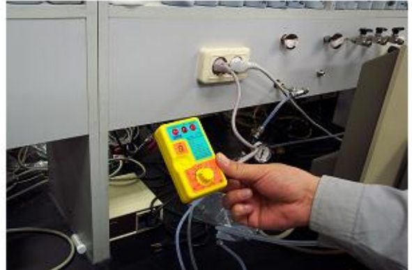
콘센트 접지상태 확인 누전차단기시험기