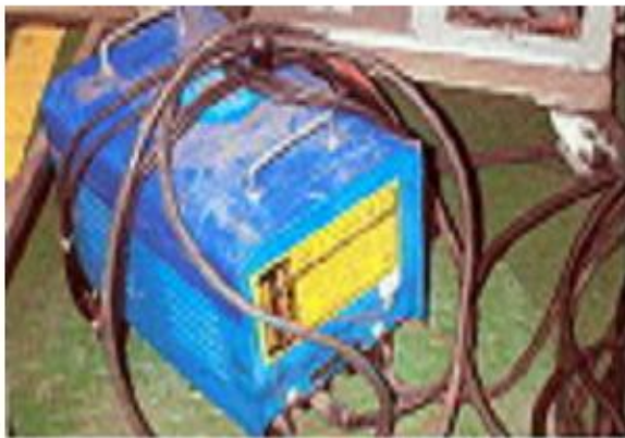
안전장치 미부착 및 충전부 단자대 노출 ×