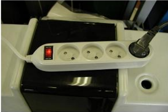
비접지구조의 멀티 콘센트