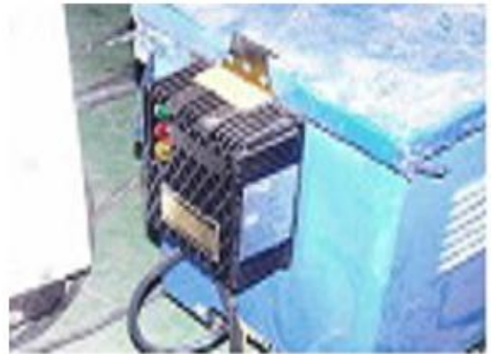
자동전격방지기 안전장치 설치 ○