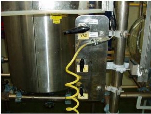
조작레버 하부에 기능표시 X