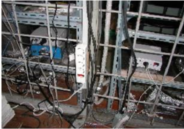
멀티 콘센트 사용 예