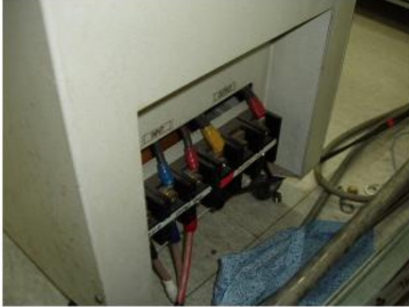
전기 충전부 단자대 노출 ×