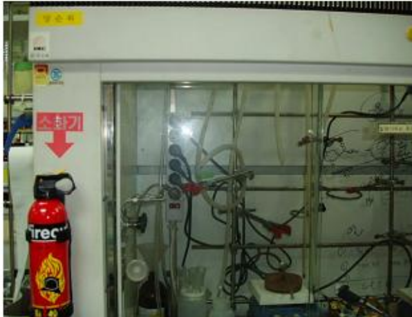
훈후드 내부 콘센트 설치 ×