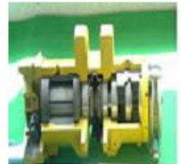
에어 모터 장착 호이스트