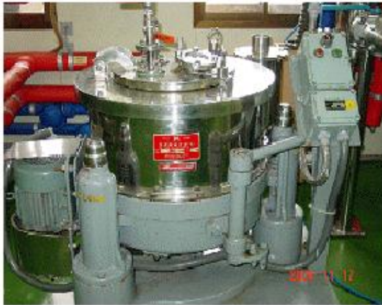
방폭구조 전기기계기구 및 접지 실시