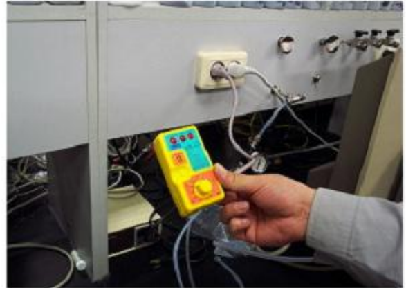
콘센트 접지상태 확인 누전차단기시험기