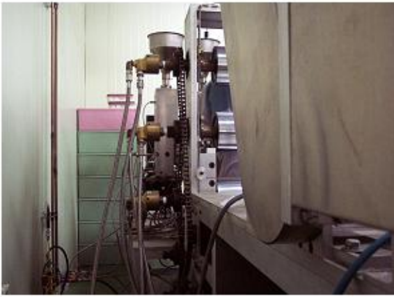
동력전달부 안전덮개 미설치 ×