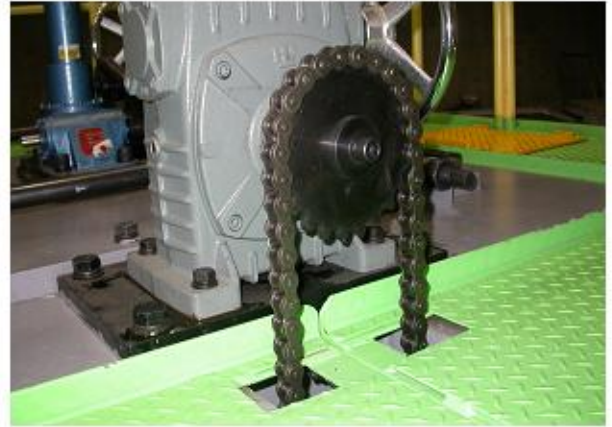
동력전달부 안전덮개 미설치 ×