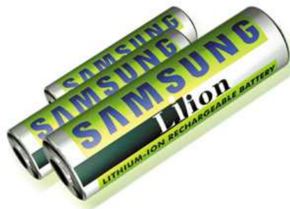
Figure 2. 삼성SDI의 2800mAh급 원통형 리튬이차전지

리튬이차전지는 응용 분야에 따라 연구 분야가 나뉘지만 기본적으로 낮은 가격으로 고용량·고출력 특성을 보이면서 안전성이 뛰어난 리튬이차전지 개발을 위해 노력하고 있다. 고용량 리튬이차전지 개발은 업계에서 경쟁적으로 이루어지고 있는 분야로 설계 최적화 및 활물질 개발 등을 통해 전지의 용량을 증가시키고 있다. 작년까지만 해도 휴대폰이나 노트북 등에 사용되어 왔던 리튬이차전지는 주로 2200mAh급이나 2400mAh급이 대부분이었으나, 최근 휴대폰과 노트북의 고급화 추세로 전력소모가 증가함에 따라 2600mAh급 제품 비중이 크게 증가하고 있다. LG화학와 삼성SDI는 2800mAh급 원통형(18650 type) 리튬이온 이차전지를 양산한다고 발표하였으며, 삼성SDI는 올해 초 3000mAh급 전지를 개발하여 연 내에 양산에 들어간다고 보고하고 있다.